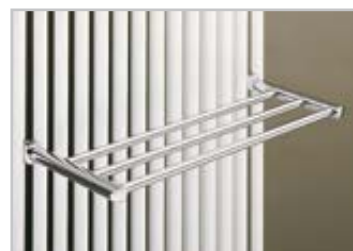
Handtuchablage Bautiefe 211 mm passend für Baulänge 599 mm; abblängbar für Baulänge 450 mm Oberfläche alu-lackiert Art. Nr. 70 878 80 226 000 Oberfläche verchromt Art. Nr. 70 878 80 227 000 passend für Baulänge 899 mm; abblängbar für Baulänge 749 mm Oberfläche alu-lackiert Art. Nr. 70 878 80 229 000 Oberfläche verchromt Art. Nr. 70 878 80 230 000