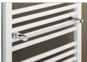
Handtuchbügel, gerade Bautiefe 75 mm passend für Baulänge 599 mm; abblängbar für Baulänge 450 mm Oberfläche alu-lackiert Art. Nr. 70 878 80 220 000 Oberfläche verchromt Art. Nr. 70 878 80 221 000 passend für Baulänge 899 mm; abblängbar für Baulänge 749 mm Oberfläche alu-lackiert Art. Nr. 70 878 80 223 000 Oberfläche verchromt Art. Nr. 70 878 80 224 000