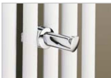
Handtuchhaken Bautiefe 74 mm Oberfläche alu-lackiert Art. Nr. 70 878 80 201 000 Oberfläche verchromt Art. Nr. 70 878 80 202 000